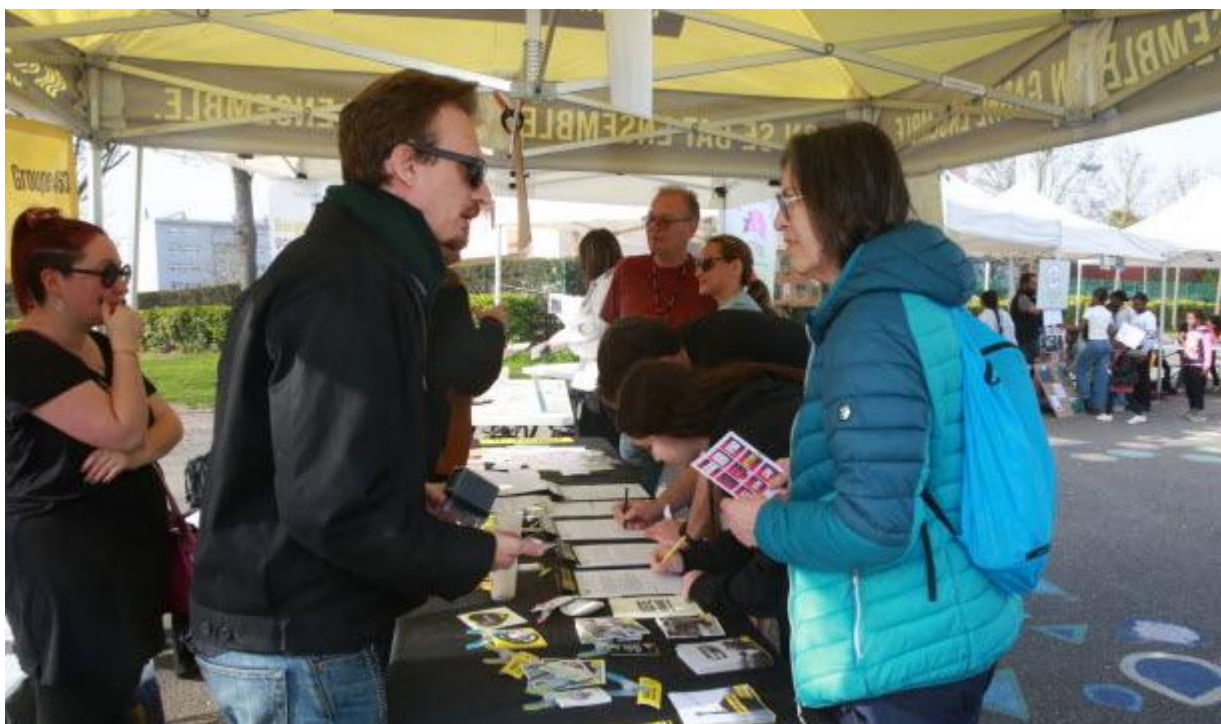
Rencontrer, parler ; ici avec Amnesty International, pour aborder les droits en général et celui des femmes en particulier.