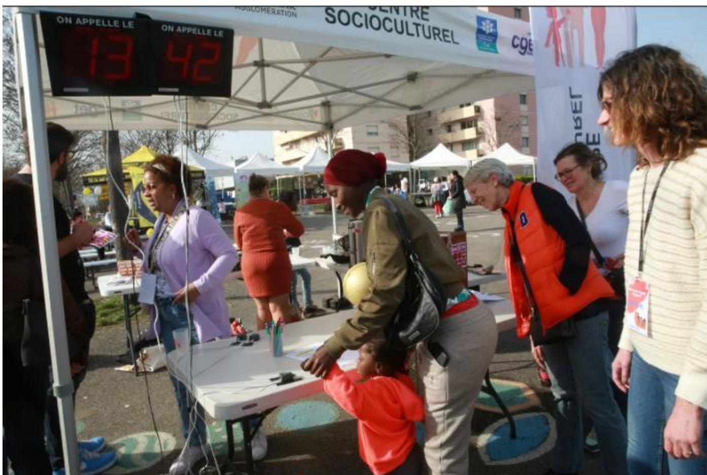
Après chaque tour, les participants pouvaient faire monter le compteur. Objectif : réaliser 1791 tours ; comme la date de publication de la Déclaration des droits de la femme par Olympe de Gouges.