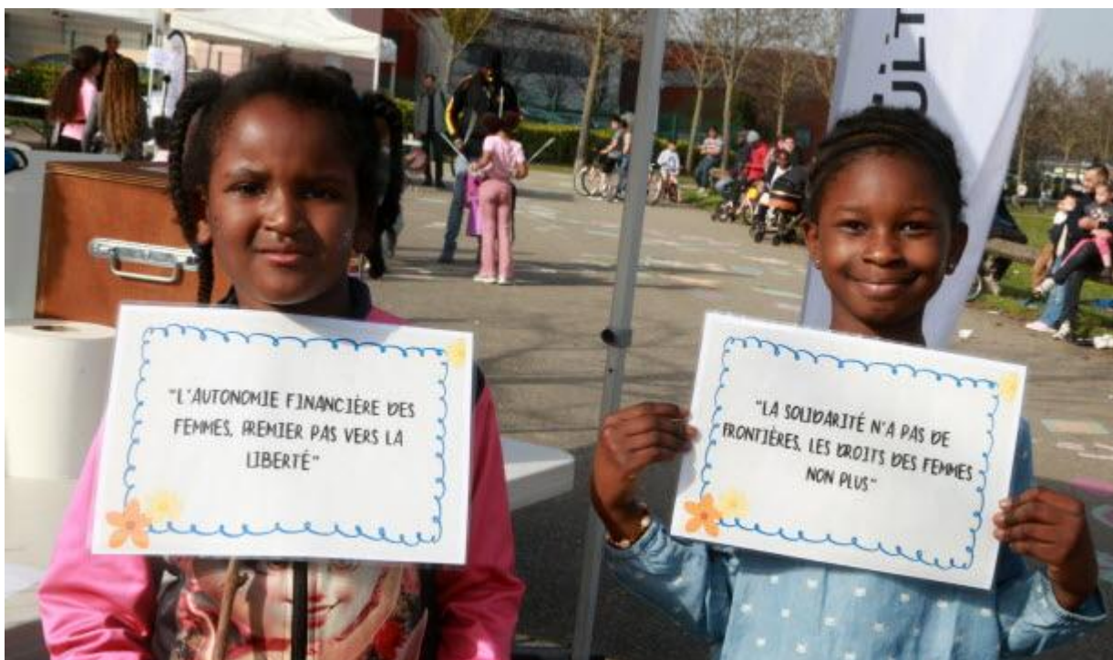
Deux jeunes filles avaient un message à faire passer, lors de la course pour l'égalité des genres.